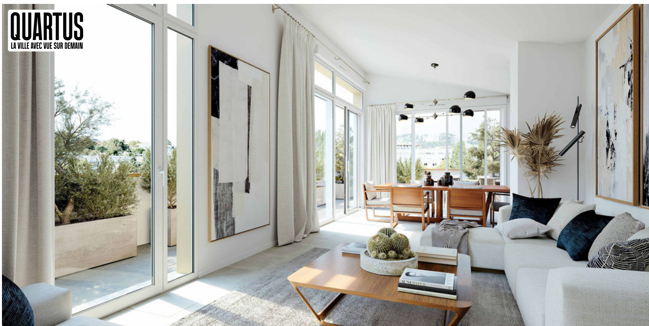
ESPRIT SAINTE-ANNE - B005