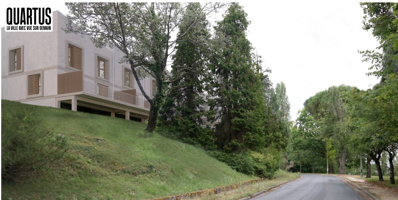
Belle Rive - 1107