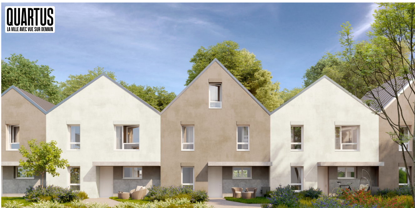
Courtil Le Mevel - A302