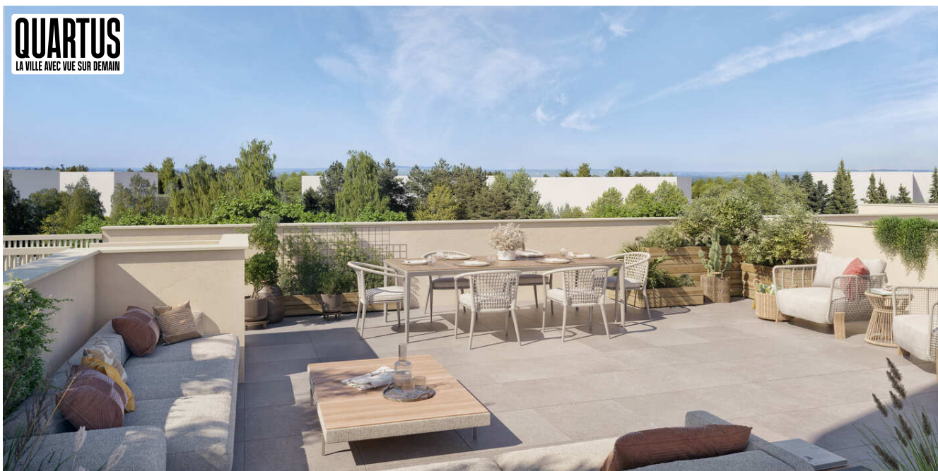
Qadence - BB06